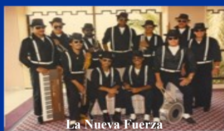
La Nueva Fuerza